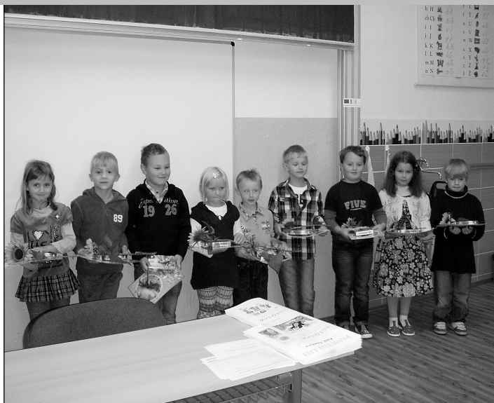
Naši noví prvňáčci